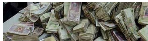
Increible: Los Bancos No Quieren Que Sepas Esos Secretos