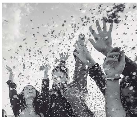
22 Motivos Por Los Que Sumarte Al Reto Madrid 2022 De Holaluz