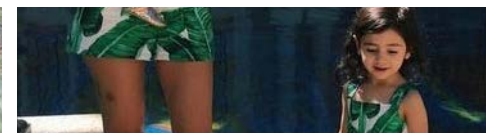
Millonaria Mamá De Madrid Expone Cómo Gana Quinientos €/hora Desde Casa