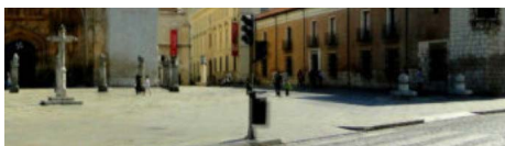
Una ruta para visitar Valladolid en un día