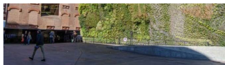
Exposiciones en Caixa Forum Madrid para 2018