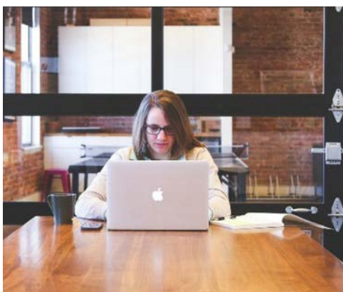
España, El País Donde Más Mujeres Dirigen Fondos De Inversión