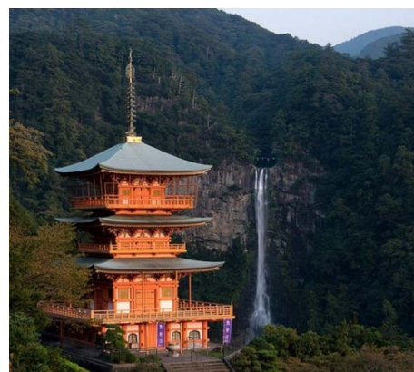
Kumano Kodo, la gran ruta de peregrinación en Japón