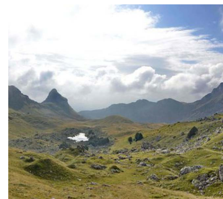
Los turistas apuestan por destinos europeos poco populares