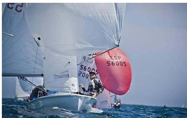
El CN El Balís, a punto para el Trofeo Cornudella