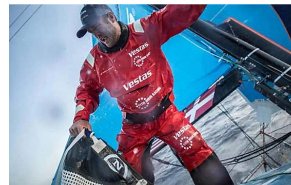
La flota se acerca al Caribe cuando casi ha cubierto la mitad del...