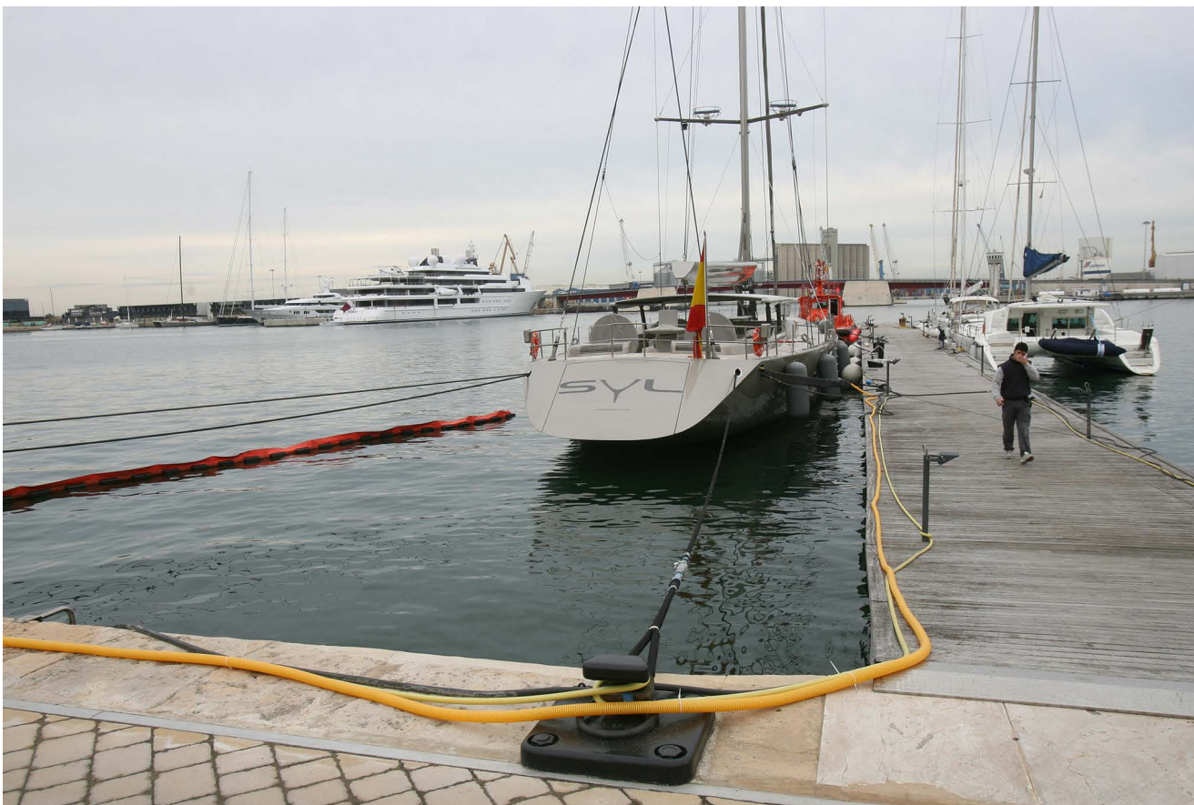
Imagen de archivo de la zona de la marina de Port Tarraco en Tarragona