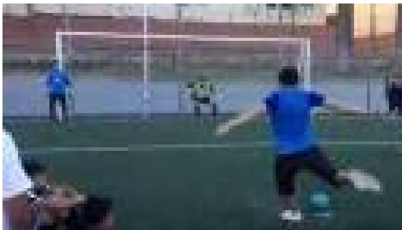
El penalti de un futbolista callejero que está dando la vuelta al mundo