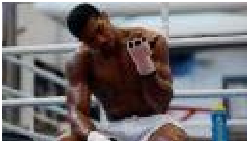
Boxeo: Anthony Joshua, el púgil de los 400 millones