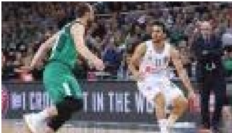
Real Madrid-Zalgiris: El Madrid no cede rumbo a cuartos