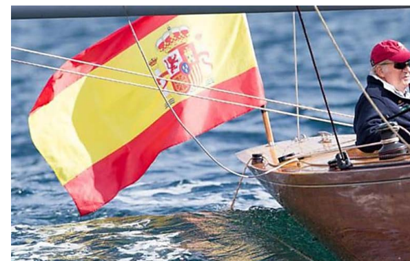
La Copa del Rey Mapfre acogerá este año a los 6m como clase invitada