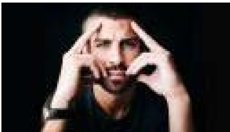
Piqué: «Dicen que soy un traidor, pero mi sueño era jugar con España»