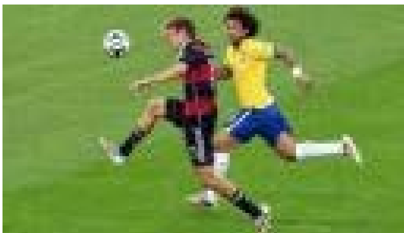
Amistosos internacionales: Los diez partidos de selecciones que no te puedes perder