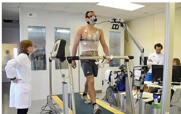
La FNOB potencia su programa de investigación junto a...