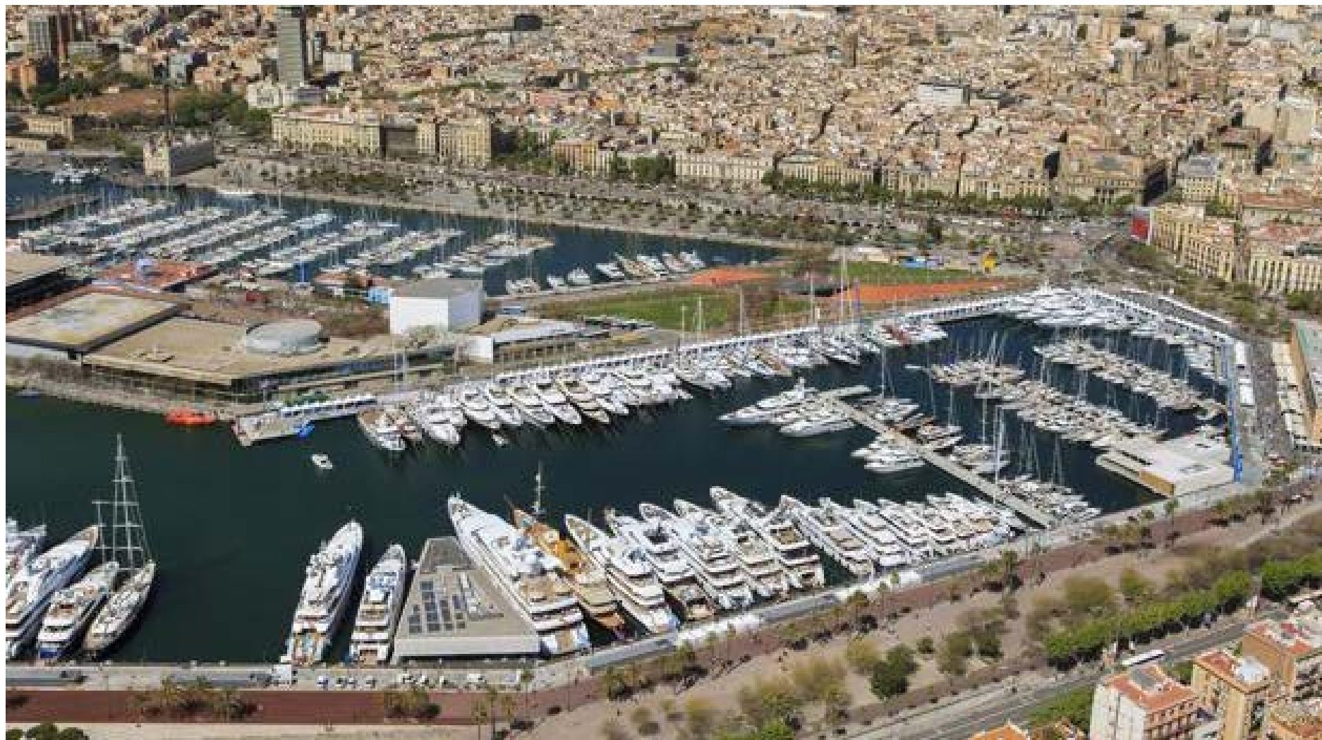
SALONES Y FERIAS