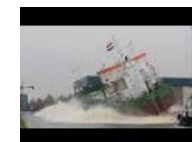
Botadura del granelero SNOW CRYSTAL

Resumen de Coordinadora del conflicto de la estiba