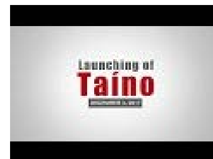
Crowley lanza el segundo barco Con-Ro impulsado por GNL

Resumen de Coordinadora del conflicto de la estiba