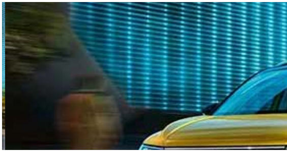
Descubre el SUV que viene para cambiarlo todo