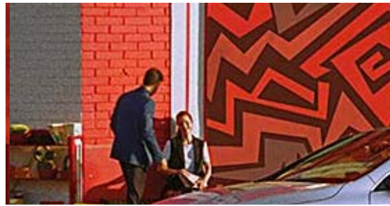
Llévate un Mercedes con equipamiento Sportive AMG y con seguro, garantía y mantenimiento.