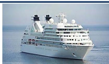
Els passatgers d'un creuer de Pullmantur...