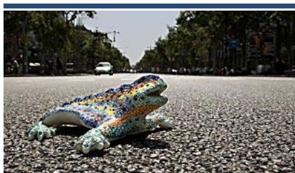
Descubre los dragones que se esconden en Barcelona