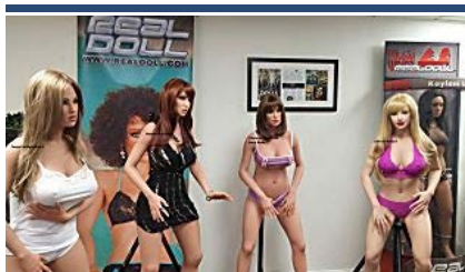
"Las muñecas de compañía fomentan el...