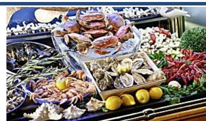
Un dels millors bufets lliures del món és a...