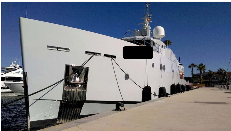
El Sexy Fish, amarrado en el puerto deportivo Marina de Dénia.

No es para menos. El Sexy Fish tiene 39,3 metros de eslora, toda la última tecnología naval y el diseño puestos al servicio de una navegación con todas las comodidades en travesías largas. Tiene una autonomía de 3.500 millas náuticas cuando navega a una velocidad de 12,5 nudos. Su velocidad máxima es de 16 nudos. Está equipado con dos motores Caterpillar C32 1450 BHP y construido con casco de acero y la superestructura de aluminio.